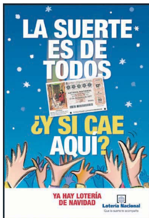
Cartel de promoción de la Lotería de Navidad.

Para saber más: http://es.wikipedia.org/wiki/Sorteo_Extraordinario_de_Navidad